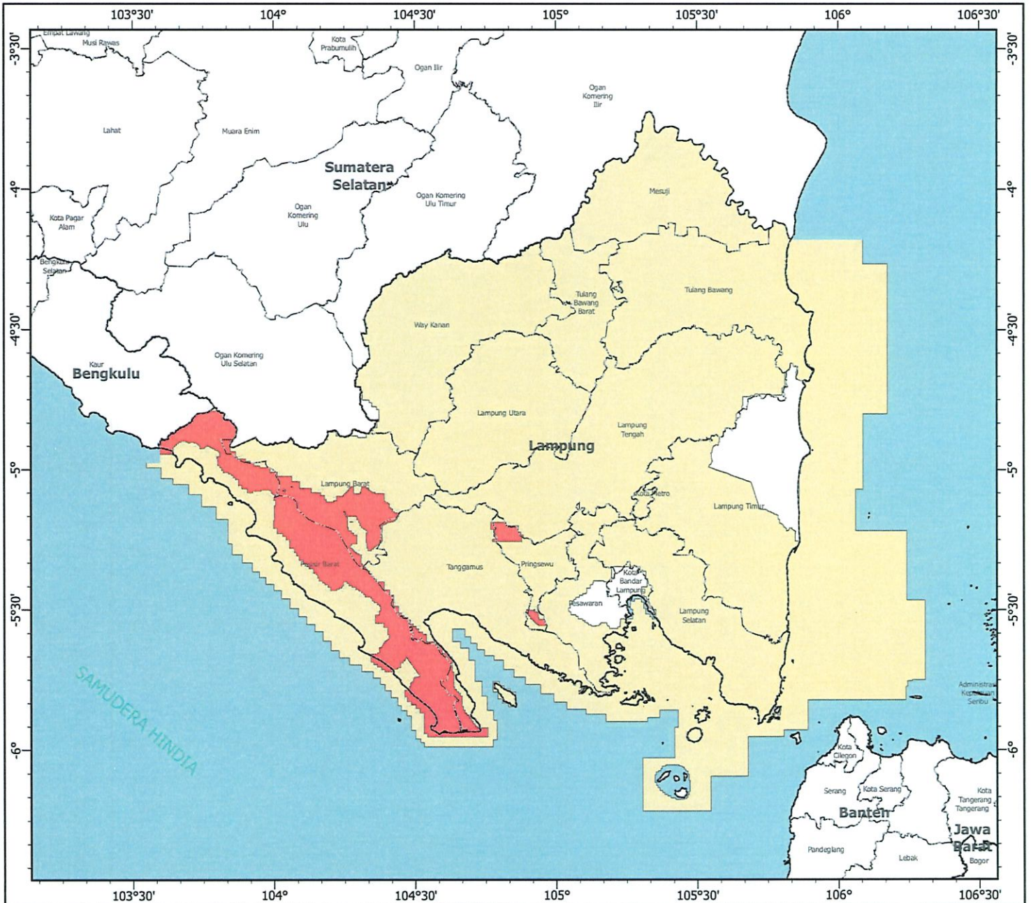
PETA WILAYAH PERTAMBANGAN PROVINSI LAMPUNG